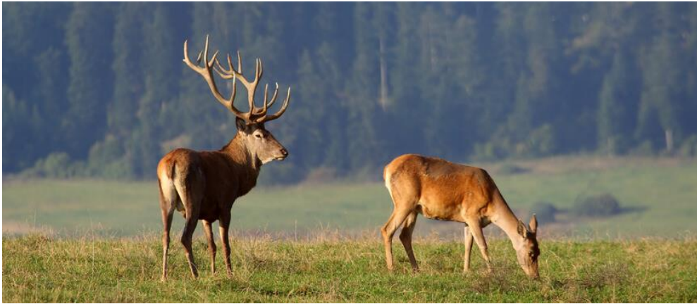
Jeleň lesný ( Cervus elaphus )