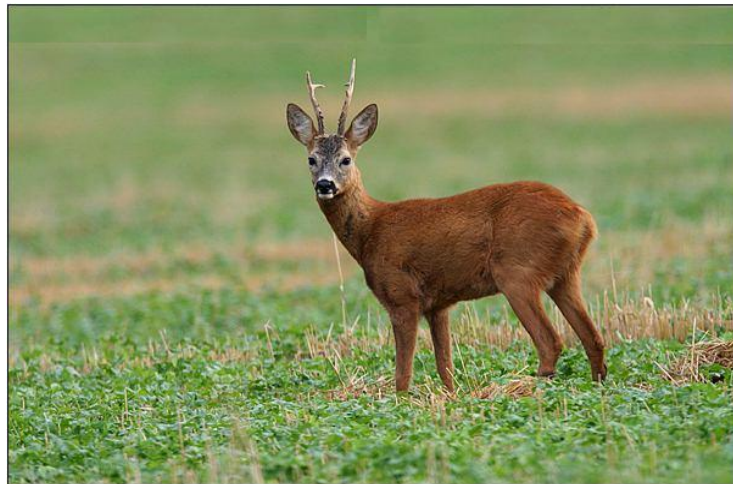
Srniec Hôrny (Capreolus capreolus)