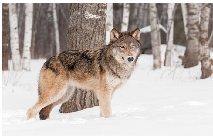
Vlk dravý ( Canis lupus )