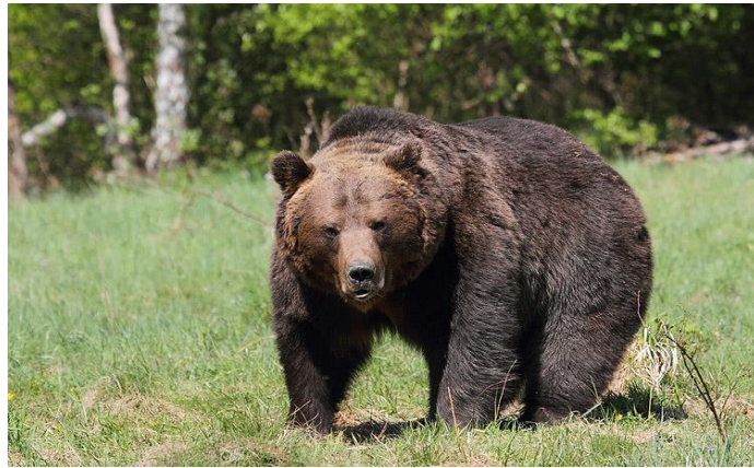
Medveď hnedý ( Ursus arctos )