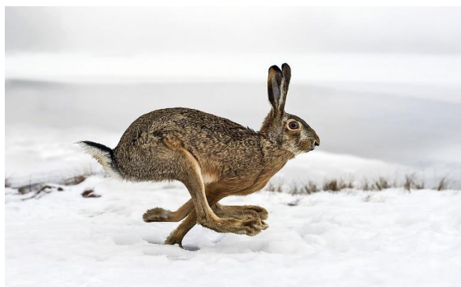
Zajac poľný ( Lepus europaeus )