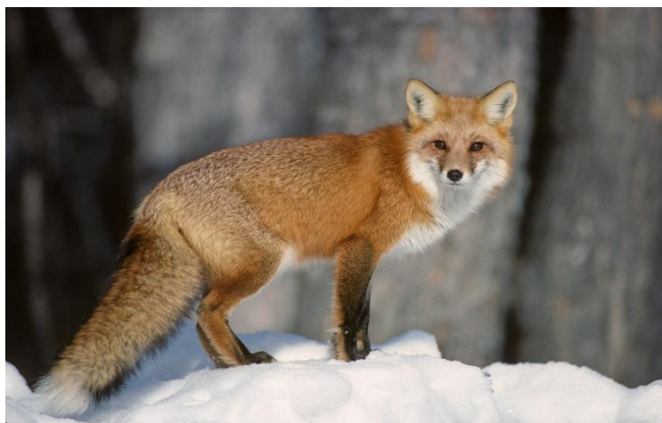
Líška hrdzavá ( Vulpes vulpes)